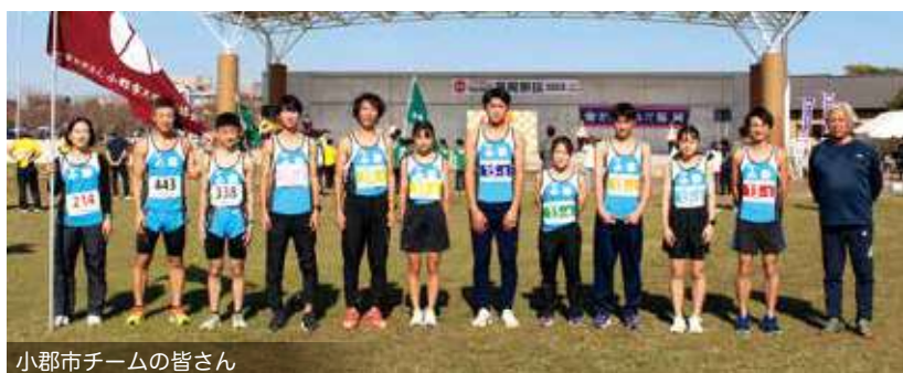
小郡市チームの皆さん