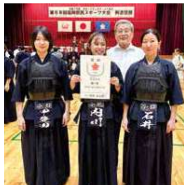
剣道競技一般女子チーム