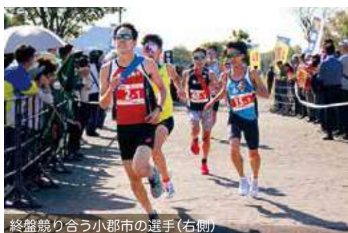
終盤競り合う小郡市の選手(右側)

県営筑後広域公園で開催された「福岡駅伝」は12回目。前回大会は9区間でしたが、今大会から8区間に変更されました。小郡市チームは昨年はケガの影響などでオープン参加となりましたが、今年は悔しい思いを糧に各選手力走！ベストを尽くしてタスキを繋ぎました。結果は総合の部第8位！(60市町村)