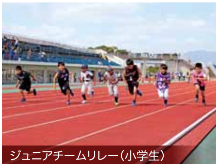
ジュニアチームリレー(小学生)