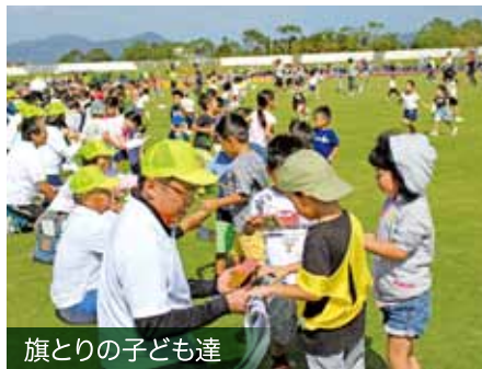
旗とりの子ども達