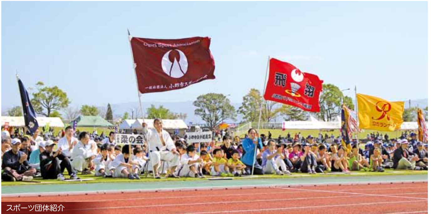
スポーツ団体紹介