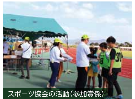
スポーツ協会の活動(参加賞係)